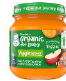
Batata, manzana, zanahoria y canela