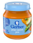
Pera, zanahoria y guisantes