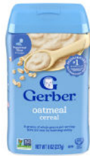
Cereales de avena