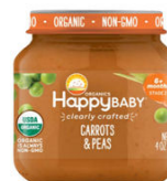
Zanahoria y guisantes