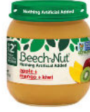
Manzana, mango y kiwi