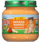
Banana y mango