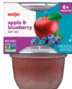
Manzana y arándano