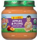
Manzana y ciruela