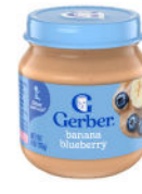
Banana y arándano