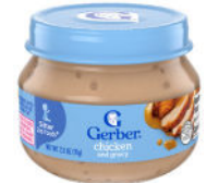
Pollo y salsa