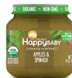
Manzana y espinaca