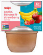
Manzana, banana y fresa

Solo alimentos de la marca Meijer. Envase doble de plástico de 2-4 onzas. Solo los tipos específicos que se indican: