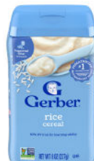
Cereales de arroz