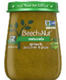
Espinaca, calabacín y guisantes