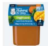
Batata, mango y col rizada