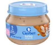
Pavo y salsa