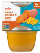
Batata y maíz