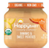
Banana y fresa