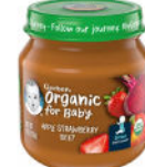
Manzana, fresa y remolacha