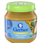
Manzana, espinaca y col rizada