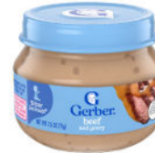
Ternera y salsa

Disponibles exclusivamente para participantes que estén amamantando. Solo alimentos de segunda etapa de la marca Gerber. Solo envases de cristal de 2.5 onzas. Solo los tipos específicos que se indican a continuación.