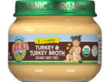
Pavo y caldo de pavo