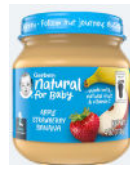
Manzana, fresa y banana

Solo alimentos 2nd Foods de la marca Gerber. Solo envases de vidrio de 4 onzas. Solo los tipos específicos que se indican a continuación.