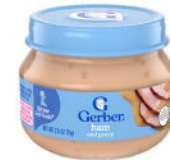
Jamón y salsa