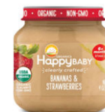
Banana y fresa