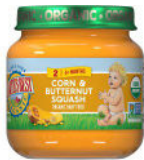
Maíz y ayote