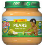
Pera y frambuesa