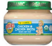
Pollo y caldo de pollo

Exclusivamente para participantes que estén amamantando. Solo alimentos de la marca de productos orgánicos Earth's Best. Solo envases de cristal de 2.5 onzas. Solo los tipos específicos que se indican a continuación.