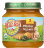
Ayote de invierno