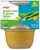
Maíz y judías verdes