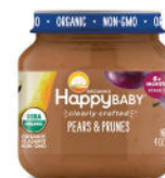
Pera y ciruela pasa