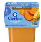
Batata y maíz