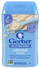
Cereales de avena sin gluten

NO SE PERMITE: con fruta añadida; con DHA/ARA añadido; cereales en frascos; paquetes de variedades.